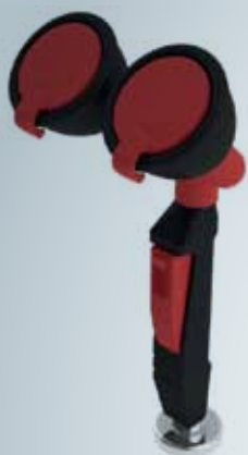
DOBBELHODET ØYEDUSJ/ HÅNDDUSJ